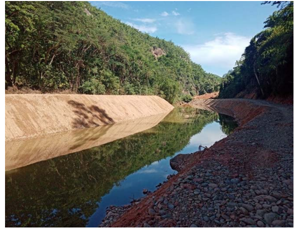
งานขุดลอกและขุดขยาย